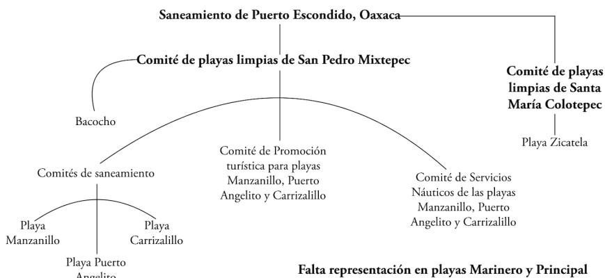
FIGURA 3 | Estructura de la organización social para el saneamiento de las playas de Puerto Escondido