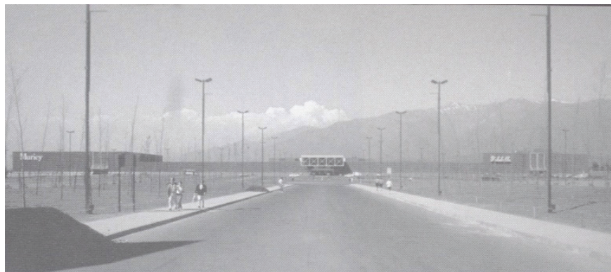
FIGURA 1 | Mall Plaza Vespucio a inicios de los 90. Vista desde Vicuña Mackenna (Occidente)