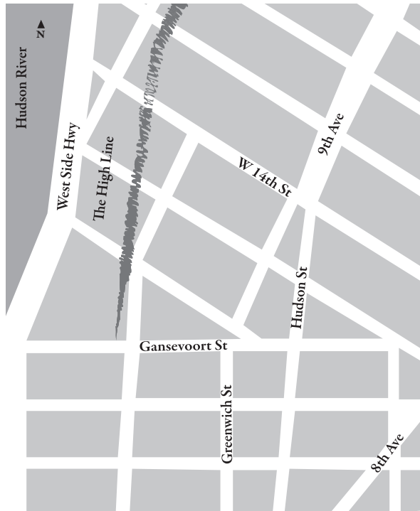
FIGURA 2 | Mapa do Meatpacking District

A construção do hotel Gansevoort em 2004 e de edifícios de luxo, a criação da High Line — o parque construído na antiga linha suspensa de trem que implicou investimentos públicos e privados de cerca de 80 milhões de dólares e que, inaugurado em junho de 2009, já recebeu mais de 2 milhões de visitantes —, além do anúncio de se transferir, para a região, a sede do Whitney Museum of American Arts, com projeto do renomado arquiteto italiano Renzo Piano, vêm fazendo do Meatpacking District, segundo a revista New Yorker , a vizinhança mais fashion de Manhattan.