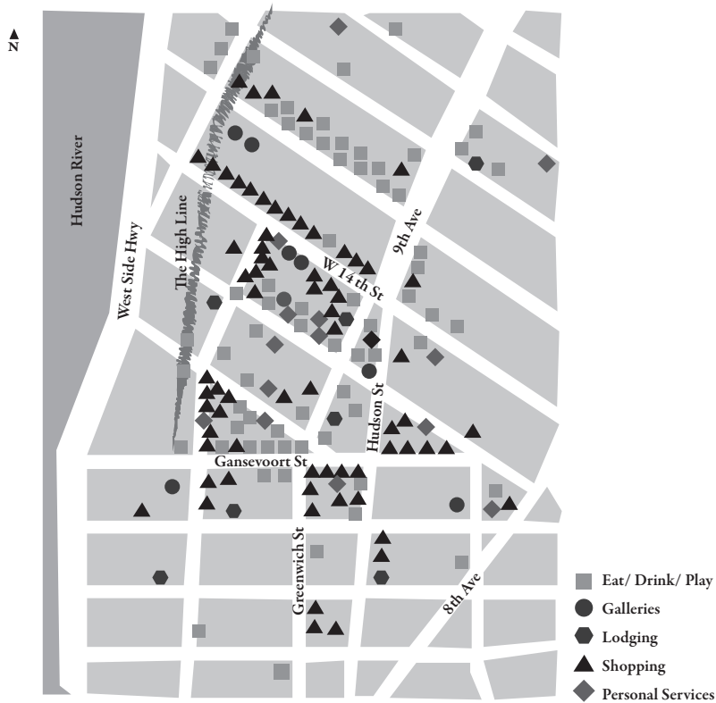
FIGURA 4 | Mapa das categorias de ocupação da região do Meatpacking District

FONTE ILUSTRAÇÃO DE CLAUDIO PARREIRAS PARA A AUTORA.