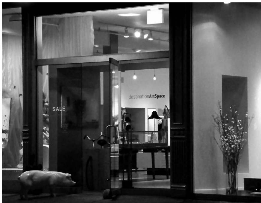
FIGURA 1 | Destination Art Space

Atualmente, pode-se dizer que a revitalização urbana e a gentrification generalizada, tal como definidas por Smith (2006), resultaram em um novo modelo de urbanização, facilitado tanto pelo poder público através da revisão dos critérios de zoneamento da cidade, quanto por associações comerciais cada vez mais fortes e inseridas na gestão do espaço urbano 7 (Zukin, 2010). Com isso, os intuitos preservacionistas, mesmo que poéticos ou utópicos de se cultivar o aspecto cultural dos lugares, foram sendo paulatinamente substituídos por outras formas de preservação, que tendem a transformar os traços históricos em meros elementos estéticos, como o porquinho de louça que se pode ver à porta da Destination Art Space, no Meatpacking District.